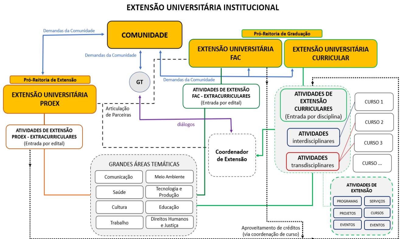
Figura 1: Diagrama da Extensão Institucional na Univap.